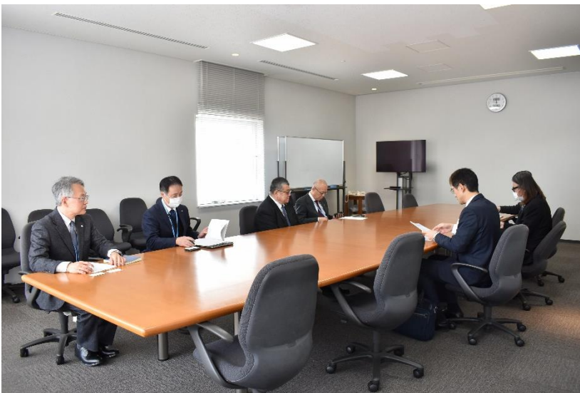
← 締結式後の懇談会の様子