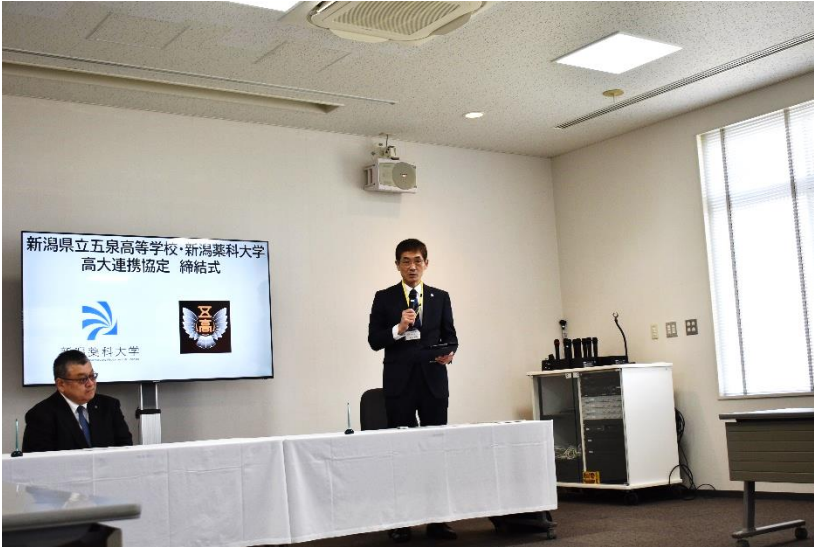
← 高大連携の目的をお互いに説明している様子

課題探究型学習のための協力及び共同実施に関すること、DXを牽引する人材育成のための協力及び共同実施に関すること、高大産連携での学習支援に関することなどにおいて、両校が連携していきます。